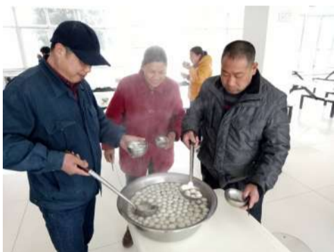
3月2日元宵节,公司各食堂为员工提供汤圆,为传统佳节增添节日的气氛。

虽然每天站立很多个小时很辛苦,但大家都保持着高昂的战斗激情。他们说:在离祖国万里之外的他乡与同事们一起,为照明事业而奋斗,是一种别样的幸福! (许珊珊)