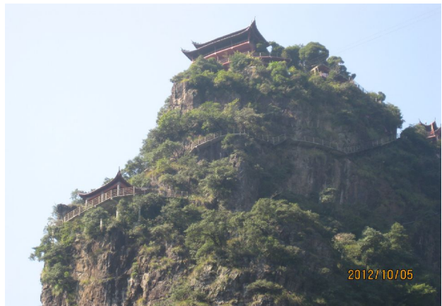
浙江武义牛头山国家森林公园。