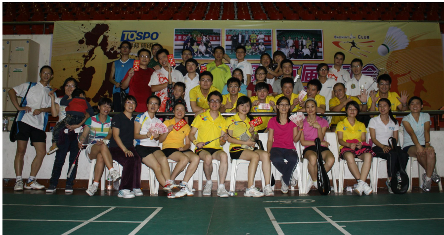
图为第六届运动会羽毛球前六名人员合影。