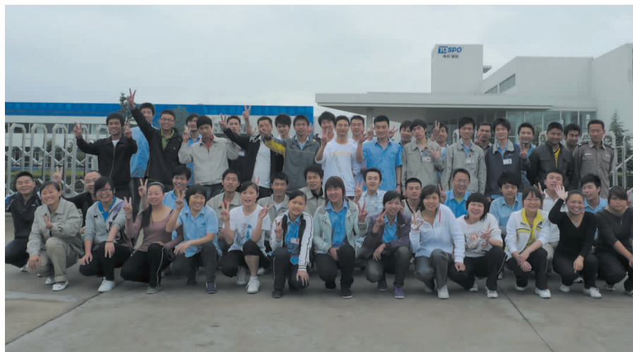
工会委员会/文