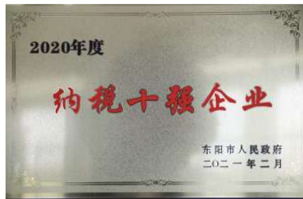
得邦照明荣获东阳市2020年度“纳税十强企业”称号。