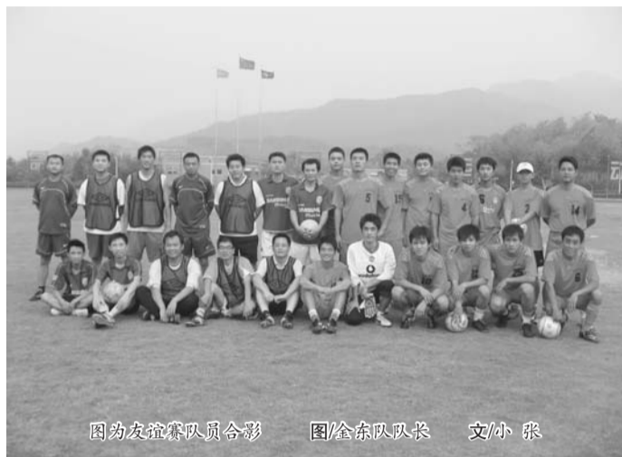
图为友谊赛队员合影 文/小张

是人海茫茫,足球场上,也增添了许多陌生的面孔,比赛进行了一半,比分为4:2我们暂时落后,在中途休息的时候,听到看台上两个学生的对话:“走吧!欧洲杯已经开始了,我们还是回去看那个比赛吧!”另一个同学回答:“欧洲杯有什么好看的,半天进不了一个球,还不如在这里看。”正如他们说的,欧洲杯一场比赛下来两个队的比分相加大多是不会超出5分,但我们一场比赛下来的比分为5:3,这可能就是专业与非专业的区分吧!得邦足球队虽然输给了金东足协,但不放弃不灰心的心态一直鼓舞着我们可爱的队员们,以后的比赛仍会继续,得邦足球队也在一次次的比赛中成长,相信自己才是最大的胜利。耶!