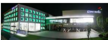
美丽漂亮的得邦总部大楼