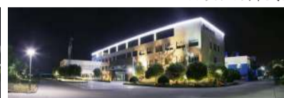
得邦工程塑料夜景