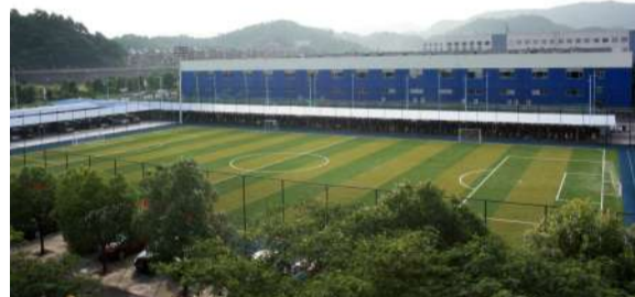
九人制标准足球场