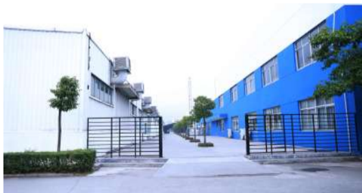
公司干净的食堂外围