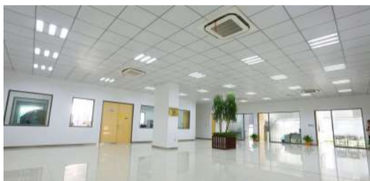
舒适大气的测试中心