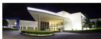
东阳得邦行政楼夜景