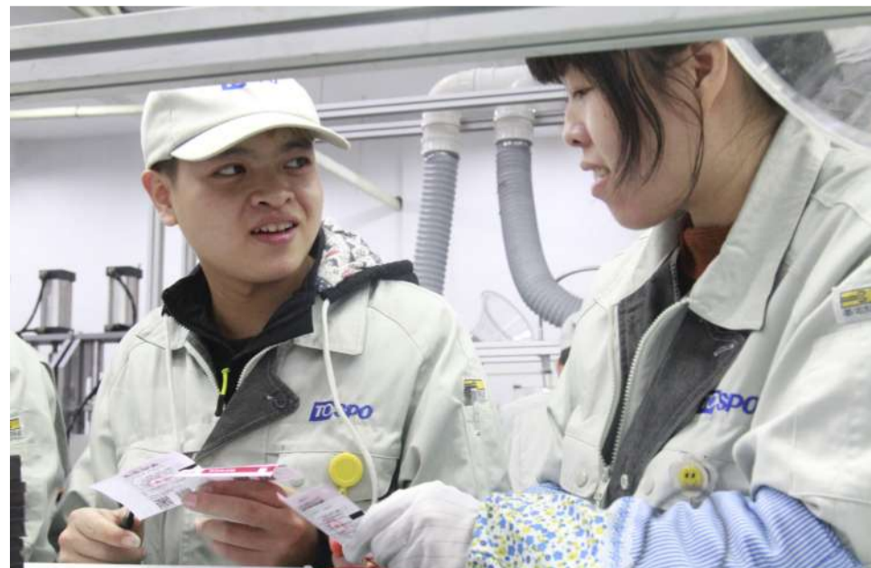
对员工来说,休息时间能去趟电影院看场电影,未尝不是件高兴的事儿。11月25日,公司按照每个部门的需求,给员工发放了电影票,让员工在闲暇时刻能和亲朋好友一起看不用排队买票的电影。

12月2日下午6点,在TP培训教室召开了2017年关键任务和活动事项讨论会议,会议人员包括经理、科长、现场专员、计划专员、统计员、线长等40余人。