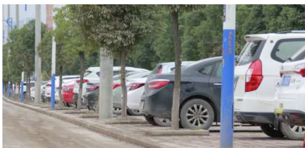
马路边整齐停放的车辆