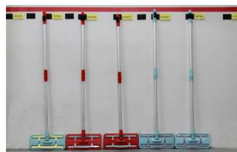
车间一角的清扫工具摆放的也很有秩序