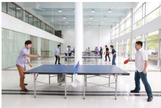
员工娱乐的活动室