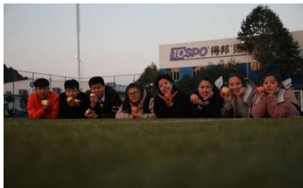
▲都说帅哥美女与苹果派对更搭哟