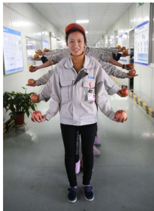
▲这是千手苹果君么？