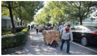
▲嘿咻嘿咻，把苹果君搬运回窝