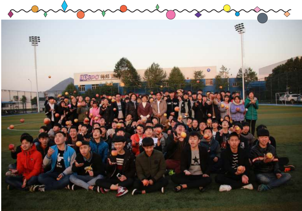
▲大派对啊，苹果君都飞上天了

俗话说：一天一个苹果，医生远离我。在很多人的眼里，苹果是健康的象征，但在圣诞节期间，它又被赋予了神圣的使命。平安夜的“平”与苹果的“苹”是谐音，所以苹果还象征着平安、幸福，据说在这个时候收到苹果，生活能平平安安、和和美美。