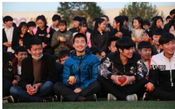
▲如此开心，你是得了什么大奖么？