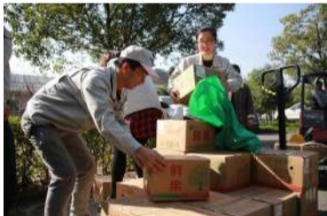
▲大家搬运的很高啊