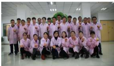
▲大家一起来个合影