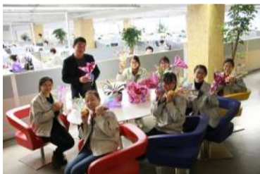
▲苹果君还可以这样包装