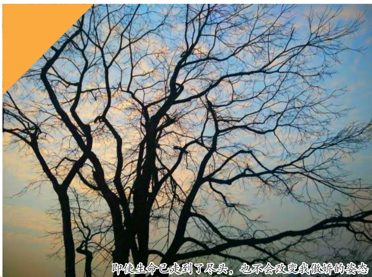
即使生命已走到了尽头，也不会改变我傲娇的姿态