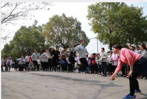
俗话说得好：跳得高，看得远