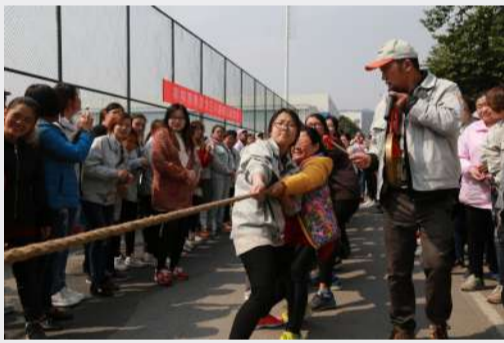
一声锣响，比赛开始了

在公司，不管是基层员工还是干部骨干，女员工的人数都占有一半多。组织此次活动，不仅丰富了女职工的业余生活，缓解了紧张繁忙的工作压力，更重要的是促进了友谊，加深了感情，使各位女职工充分感受到了节日带给她们的喜悦和快乐，为女职工身心健康办了实事、办了好事，同时激励大家以更加饱满的热情、最佳的工作状态创造新的业绩，极大地增强了公司的凝聚力和向心力。