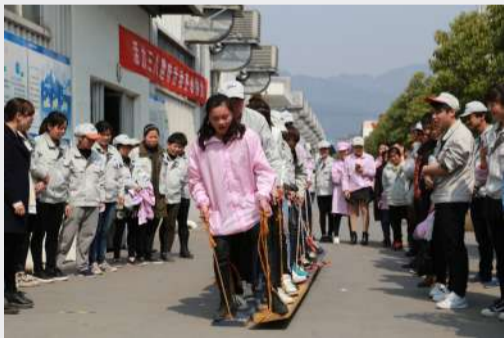
齐心协力，争取做到最好